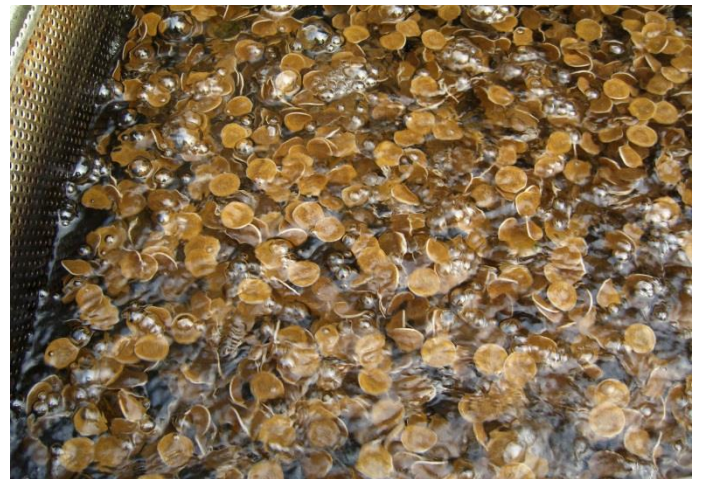
Bild 4: Nitrifikation mittels Mutag BioChip 30™ RAS Process in einer Fischzuchtanlage

Oberflächen beider Trägermaterialien bei dem herkömmlichen Medium 25% (150 Liter) und bei dem Mutag BioChip™ 7,3% (44 Liter) betrug. Die anfänglich geringe Futtermenge war zu Beginn der Versuche Anfang Februar 2010 an die sehr niedrige Wassertemperatur von 10°C angepasst, wobei das temperaturabhängige Wachstum der Nitrifikanten auf den Trägermaterialien einige Wochen in Anspruch nahm. Die Aktivität der Biofilme nahm mit steigenden Wassertemperaturen und entsprechend erhöhter Futtermenge zu. Im MBBR des Mutag BioChip™ RAS Process lagen die Ammoniumkonzentrationen auch bei maximalen Wassertemperaturen von 21°C Durchschnitt bis 25°C Spitze und 500 g Futter pro Tag permanent unter 0,1 bis 0,2 mg \text{NH}_4\text{/L} . Da bei diesen Versuchen lediglich die Nitrifikationsleistungen betrachtet und somit keine Denitrifikation in einem zweiten MBBR-Behälter durchgeführt werden sollte, wurde zur Einhaltung der für die Besatzfische ungefährlichen Nitratkonzentration 5 bis 15 % Frischwasser pro Tag in das System eingeleitet. Die spezifischen Ammonium-Umsatzraten auf dem Mutag BioChip™ wurden mit bis zu 0,24 kg \text{NH}_4\text{-N/m}^3 am Tag gemessen, wobei die auf den Trägermedien immobilisierte Biomasse in beiden MBBR-Behältern trotz des geringeren Füllgrades bei dem Mutag BioChip™ gleich war.